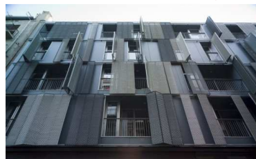
Fotografia dels habitatges del carrer Cavallers, 14-20