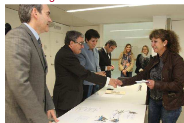
amb alta resolució