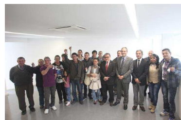
amb alta resolució

Dels 10 habitatges, vuit estan situats a l'edifici annex del convent de Santa Clara i dos al carrer Lluís Besa